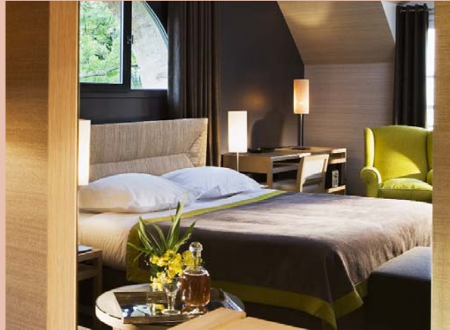
Une des nouvelles chambres du Spa

Le Spa , relié à La Fresnaye, abrite les 15 chambres les plus récentes au style résolument contemporain dans des tons qui marient le brun profond, le chanvre ficelle avec l'aubergine et le vert anis.